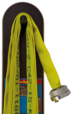
Planche à enrouler les tuyaux