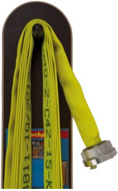
Planche à enrouler les tuyaux